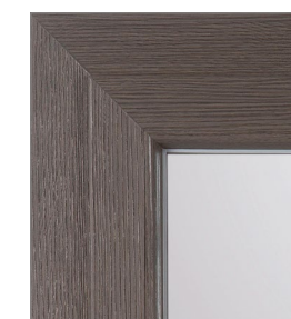
Particolare cerniera a scomparsa